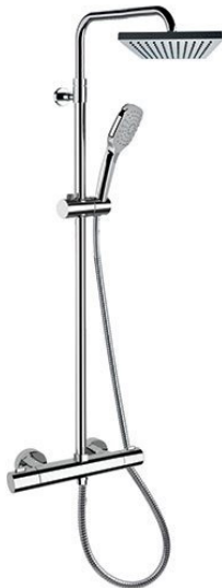
IMMAGINE - IMAGE