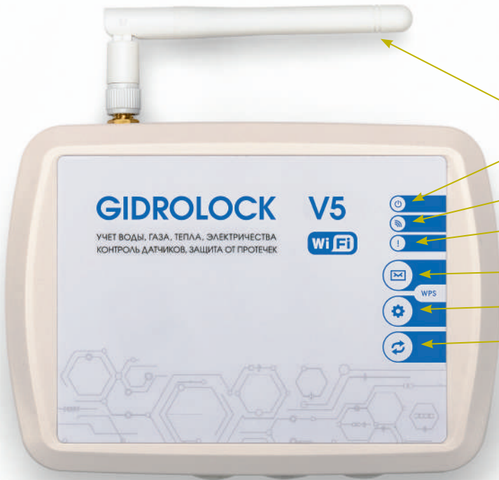
Фото 3. Блок управления GIDROLOCK Wi-Fi V5