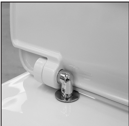
06 Alloggiare il Cw negli appositi fissaggi senza bloccare. Insert the seat cover in the appropriate fixings do not block.