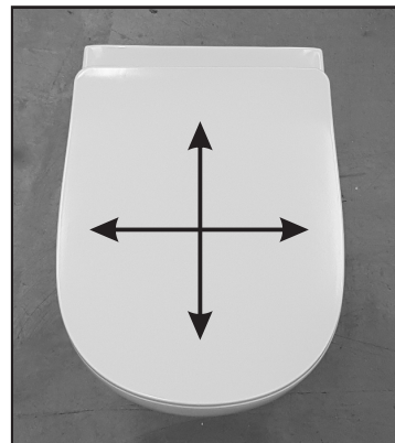
07 Verificare il corretto posizionamento del copriwater prima di serrare definitivamente il fissaggio. Before tightening the fixing screw check the correct position of the seat cover.