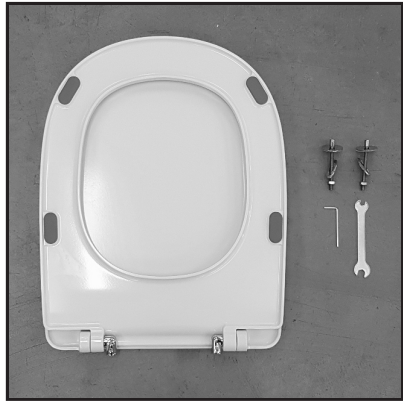
01 Composizione. Composition.