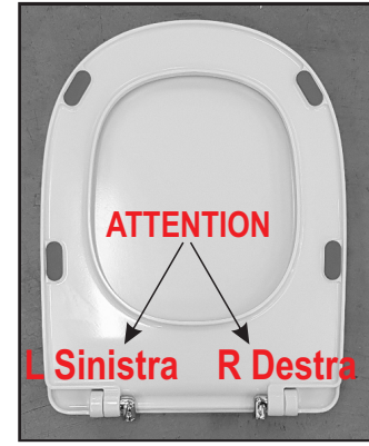
05 Inserire le cerniere negli appositi fori. Insert the hinges in the appropriate openings.