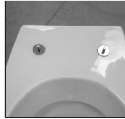
04 Fissaggi inseriti. Inserted fixing screws.