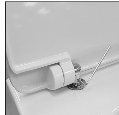
09 Stringere con la chiave in dotazione (brucola) la cerniera sul pin di fissaggio. Tighten the hinge on the screw's pin by using the provided key.