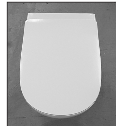
10 Copriwater installato. Installed seat cover.