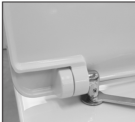
08 Stringere con la chiave in dotazione il fissaggio. Tighten the fixing screw by using the provided key.